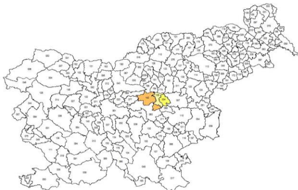
Slika 1: Kartografski prikaz obravnavanega območja treh občin: Hrastnik, Trbovlje, Zagorje ob Savi

Občine Hrastnik, Trbovlje in Zagorje ob Savi ležijo skoraj v osrčju Slovenije in mejijo na Savinjsko, Osrednjeslovensko, Spodnjeposavsko in Jugovzhodno statistično regijo. Območje LAS meji na osem občin: Litijo, Moravče, Lukovico, Kamnik, Radeče, Laško, Prebold in Vransko ter leži v osrčju Posavskega hribovja na skrajnem jugovzhodu Savinjskih Alp. Prepoznano je po vrhovih Kum, Kopitnik, Mrzlica, Zasavska sveta gora in Čemšeniška planina. Reka Sava je s svojimi dotoki globoko zarezala v hribovito območje in tako ustvarila zelo razgiban relief. Ob njej poteka železnica in regionalna cesta, ki povezuje Zasavske doline z glavnim mestom Ljubljano in jugovzhodnim delom Slovenije – Dolenjsko. Ob pritokih reke Save, so pod omenjene vrhove stisnjene doline, poseljene z velikim številom prebivalstva, ki se je tekom časa tu skoncentriralo, zaradi hitro rastoče industrije. Tako so na območju LAS tri glavna urbana območja, oz. središča v somestjih (somestja za središča nacionalnega in regionalnega pomena) Hrastnik, Trbovlje in Zagorje ob Savi. Tem se, po Pravilniku o določitvi dodatnih drugih urbanih območij za potrebe lokalnih akcijskih skupin (MGRT, 2015) pridružujejo še urbana naselja Izlake, Kisovec in Dol pri Hrastniku. Celotno območje LAS se uvršča med območja z omejenimi dejavniki za kmetovanje z gričevnato hribovsko reliefno zgradbo, ki onemogoča razvoj intenzivnega kmetijstva.